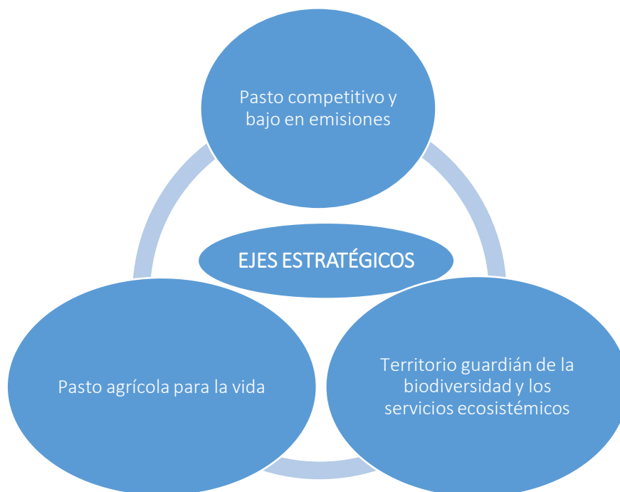
Figura 1. Ejes estratégicos del Modelo de Gestión Climática